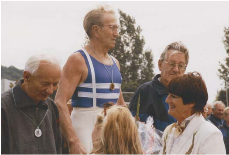
Ein Freyburger Stammgast auf dem Treppchen...