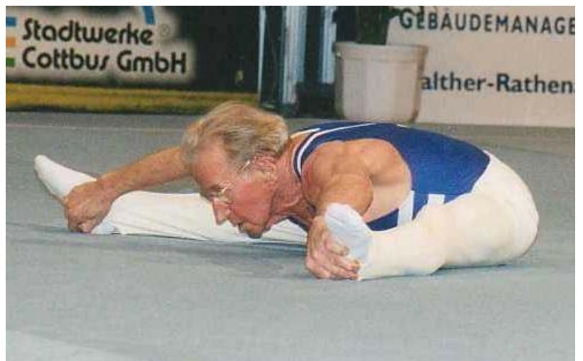
Die Fliege (Briefmarke) – etwas für zähe Burschen...